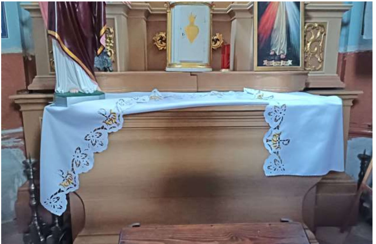
Fot. 26. Ołtarz w kaplicy wsch. z obrazem św. Franciszka z Ksawery w kośc. pw. Św. Jana Chrzciciela w Przyłęku. Widok na ołtarz przed konserwacją. Widoczne zniszczenia drewna i nawarstwień malarskich oraz złoconej snycerki.