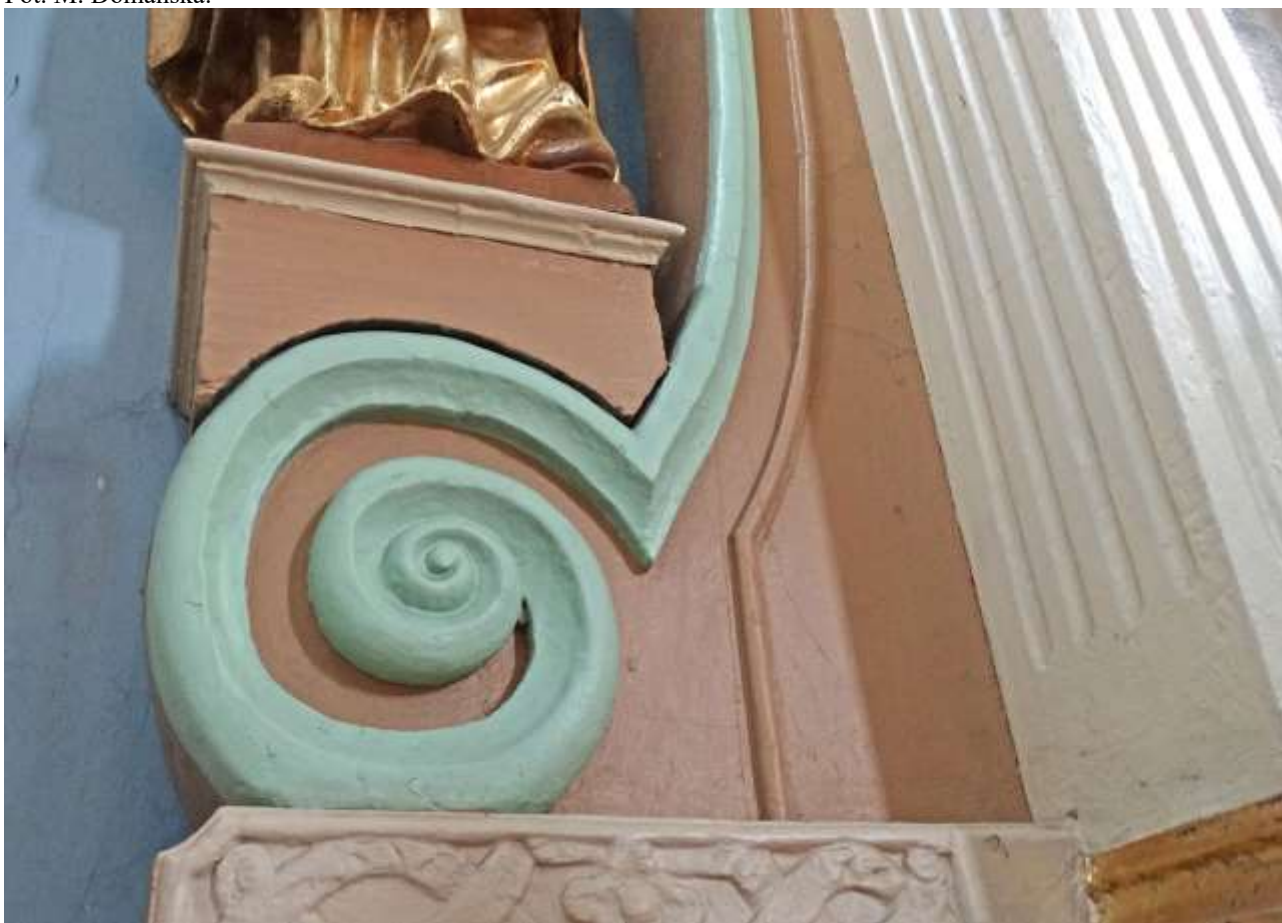
Fot. 22. Ołtarz w kaplicy wsch. z obrazem św. Franciszka z Ksawery w kośc. pw. Św. Jana Chrzciciela w Przyłęku. Widok na ołtarz przed konserwacją. Widoczne zniszczenia drewna i nawarstwień malarskich oraz złoconej snycerki.